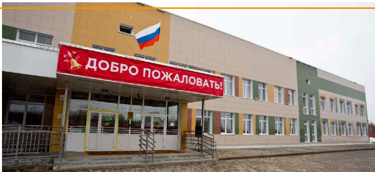
Школа-комплекс п. Высокий Мыс, Сургутский район

В ближайшей перспективе по этому механизму планируем реализовать проекты по строительству плавательного бассейна в п. Фёдоровский и тренажёрного зала в п. Ульт-Ягун.