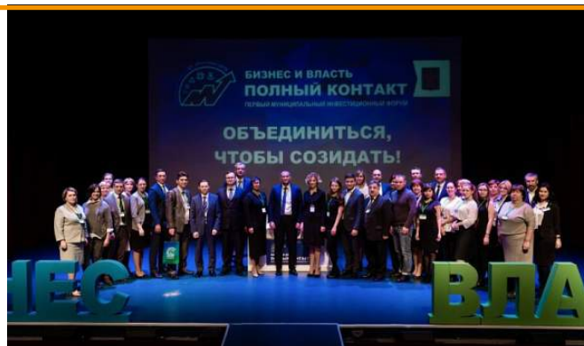
I муниципальный инвестиционный форум «Бизнес и власть – полный контакт»

– Это был наш первый опыт – I муниципальный инвестиционный форум на территории нашего региона. Первый опыт